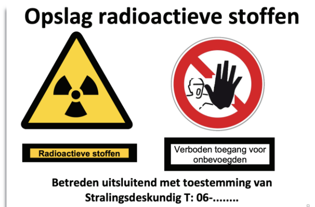
Figuur 4. Voorbeeld markering afgescheiden deel van de locatie

Onderstaand is een voorbeeld opgenomen van een markering voor een afgescheiden deel van de locatie: