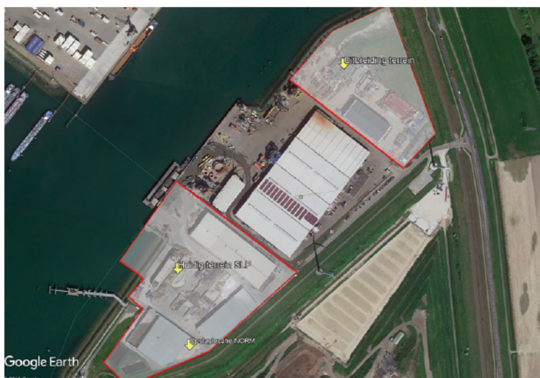
Afbeelding 1. Overzicht van de oude en nieuwe locatie

In onderstaande afbeelding is een overzicht gegeven van de beide locaties waarbij de nieuw locatie is aangeduid als "uitbreiding terrein". De beide locaties worden gescheiden door een locatie die in eigendom is van Holland Shipyard Group.